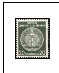
20 p 50D