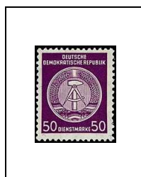
50 p 50G