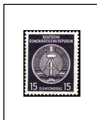
15 p 50C