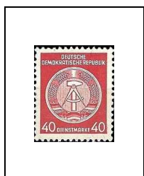
40 p 50F