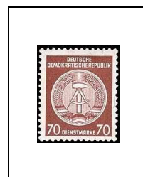
70 p 51