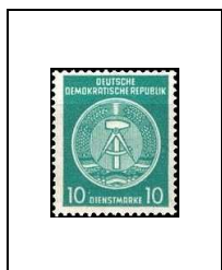
10 p 50B