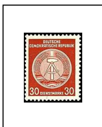
30 p 50E