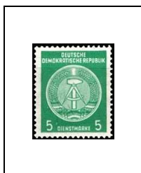
5 p 50A